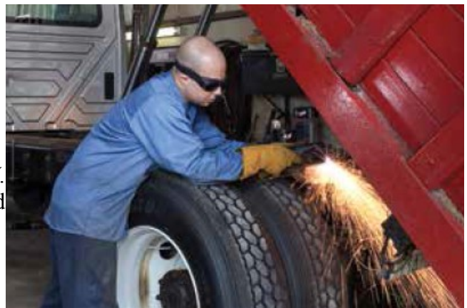
Modifikacija i popravka vozila