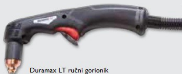
Duramax LT ručni gorionik