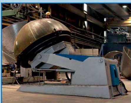
Rotacione stege - pozicioneri sa paralelnim podizanjem, iskošenjem i funkcijom rotiranja do 250t