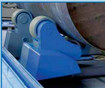
Okretaljke za konzolne aparate za zavarivanje od 5 do 150 tona