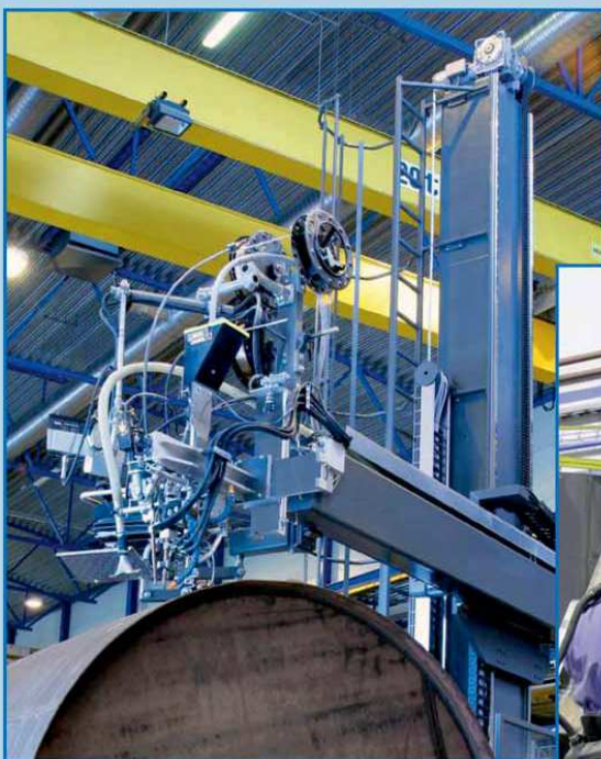
Konzolni aparati za EPP zavarivnje / zavarivanje pod praškom sa stubom i konzolom od 3x3m do 10x10m